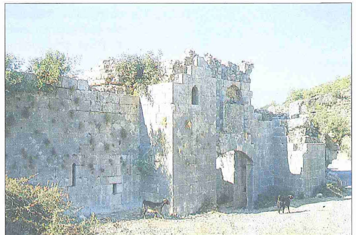
Alara Hanı'nın cepheden görünüşü