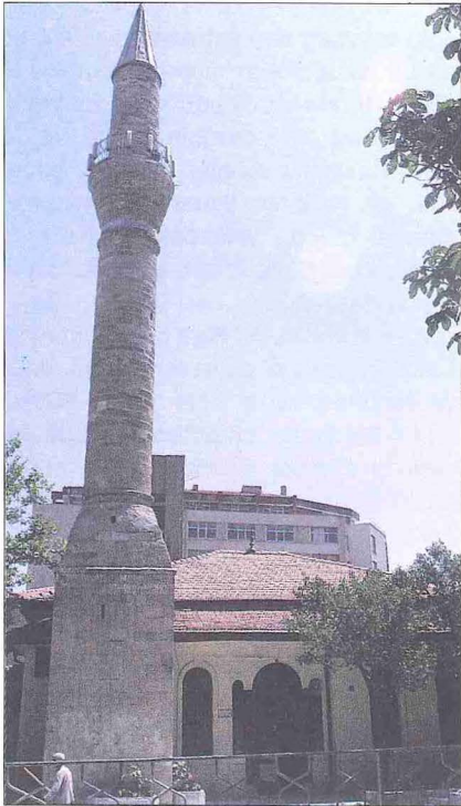
Ali Paşa Camii - Kütahya

Halk arasında Alo Paşa Camii adıyla da anılan ve Gazikemal (Şehreküstü) ma-hallesinde bulunan cami, İsmail Hakkı Uzunçarşılı'nın yayımladığı, fakat bugün mevcut olmayan kitâbesine göre 1211