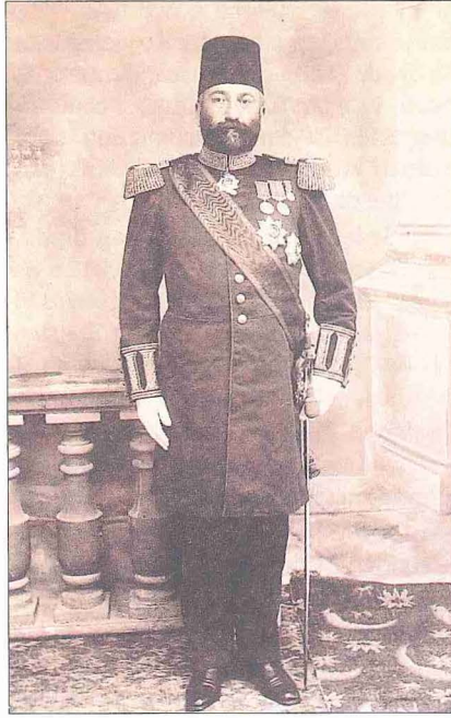
Ali Rızâ Paşa

Karşılıklı telgraflarla yapılan bu görüşmeler bir süre sonra çıkmaza girince, Cemal Paşa'nın ricası üzerine gazeteci Yunus Nadi, İstanbul hükümeti ile Sivas'taki Hey'et-i Temsiliyye'nin uzlaşması konusunda yoğun faaliyete başladı. Bundan da bir sonuç alınamayınca, Harbiye Nâzırı Cemal Paşa bizzat telgraf