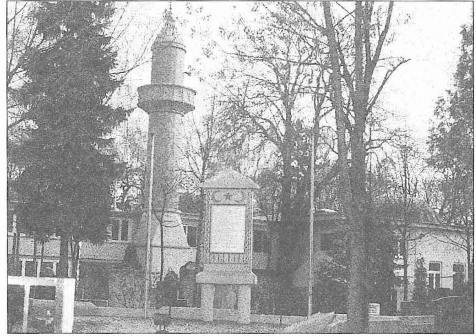
Batı Berlin'de Türk Şehitliği Cami ve Anıtı - Almanya

1960'tan sonra ülkeye yeni bir müslüman akını başladı. Bu defa Türkiye'den gelen Türkler hem kendi işsizlik sorunlarını çözdüler, hem de gelişen Alman ekonomisinin ihtiyaç duyduğu iş gücüne katkıda bulundular. 1961-1973 yılları arasında Almanya'ya giden Türk işçi sayısı, 648.029 iken 1974-1986 yılları arasında bu ülkeye 9861 işçi gitmiştir. Almanya'daki Türk vatandaşlarının sayı-