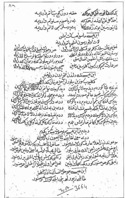
Natk-ı İbn İsâ adlı eserden bir sayfa (Millî Ktp., nr. 3664, vr. 86 a )

ği, Muhammed Rûmî'nin ise tekkesini İstanbul yakınlarında bir yere kurduğu belirtilmektedir ( Menâkıb-ı Şeyh Mecdüddîn , vr. 73 a ).