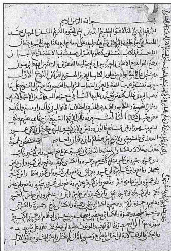
İbnü'l-Bârizî'nin Kitâbü'l-Bustân fi 'ulûmi'l-Kur'ân adlı eserinin ilk iki sayfası (TSMK, III. Ahmed, nr. 113)