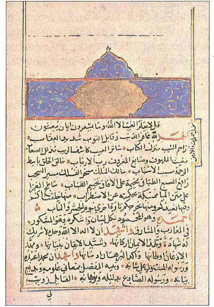
Sirâceddin İbnü'l-Verdî'nin Harîdetü'l-acâ'ib adlı eserinin ilk sayfası (Süleymaniye Ktp., Beşir Ağa, nr. 435)

eserde çeşitli ilim ve fenlerden bahsedildikten sonra birinci kısmında coğrafi bölgeler, dağlar, nehirler, ikinci kısmında bitkiler, hayvanlar, madenler ve bu madenlerin özellikleri, yararları hakkında bilgi verilmektedir. Kozmografik bir yaklaşımla kaleme alınan eserde kıyamet alâmetleri de konu edilmekte, gerçeklerle hayaller, tarihî olaylarla efsaneler iç içe anlatılmaktadır.