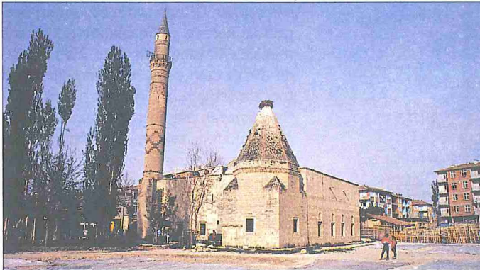
İbrâhim Bey İmaretî ve Kümbetî – Karaman

Eski adı Lârende olan Karaman'ın İmaret mahallesinde yer alan yapı topluluğu İbrâhim Bey Zâviyesi ve İbrâhim Bey Medresesi olarak da anılmaktadır. Şevval 835 (Haziran 1432) tarihli vakfiyesi ve Muharrem 836 (Eylül 1432) tarihli kitâbesinde "imaret" olarak adlandırılan yapının Karamanoğlu Beyi II. İbrâhim Bey tarafından yaptırıldığı anlaşılmaktadır. İkiisi geniş kapsamlı, diğerleri küçük altı vakfiye eki Topkapı Sarayı Müzesi Kütüphanesi'nde bulunmaktadır. Vakfiyelerin ikisi 835 (1431-32) ve diğerleri sıra ile 843 (1439-40), 849 (1445), 851 (1447) ve 870 (1465-66) tarihli olup hepsi tomar halinde birbirine bağlı, uzunluğu 7 metreyi bulan bir belgedir. Ayrıca medresenin içinde, kapı alınlıklarında yedişer satır halinde taşa işlenmiş iki vakfiye özeti yer almaktadır (Uzunçarşılı, I/1 [1937], s. 56-144, rs. 9-10). Vakfiyede imaretin Karaman'ın doğusunda Yoğunduar mevki-