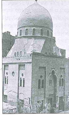
İbrâhim Gülşenî Türbesi - Kahire / Mısır

maktadır. Memlûklü tarzında tamamen taştan yapılmış olan sivri kubbe XV. yüzyılın sonunda inşa edilen sultan ve emîr türbelerine benzemektedir. Türbenin doğu ve batısında dervişler için yapılmış ikişer katlı hücreler mevcuttu. Bunların üst katları tamamen, alt katları da kısmen yıkıktır. Güneyde türbenin arkasında bir bahçe vardı. Tekkenin vakfiyesinden, bahçede de ibadet edilebilmesi için set üzerinde bir mihrap yapıldığı anlaşılmaktadır. Türbenin mimari manzume içindeki yeri Kahire için alışılmamış bir durumdur. İdeal yerleşim planı, türbenin caminin bir yanında ve sokağa yukarıdan bakan bir mevkide bulunması iken burada türbe sokağa hâkim olmayıp avlu içinde ele alınmıştır. İbrâhim Gülşenî Tekkesi'nde bir diğer özellik de caminin üstünde yaşama birimlerinin bulunmasıdır.