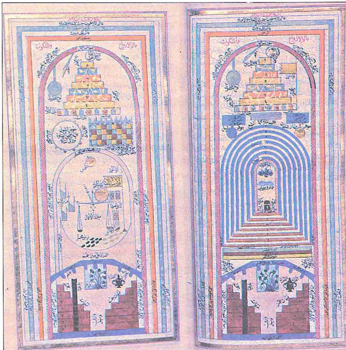
İbrâhim Hakkı Erzurumî'nin Ma'rifetnâme 'sinden şekilli iki sayfa (İstanbul Arkeoloji Ktp., nr. 87, vr. 16 b -17 a )