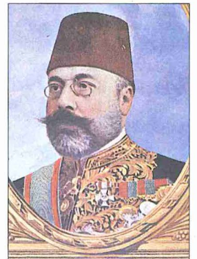
İbrahim Hakkı Paşa

İttihatçılar'ın desteğiyle meclisten güven oyu alan Hakkı Paşa kabinesi kısa zamanda bu cemiyetin güdümüne girdi. Liyakatsiz kişilerin önemli mevkilere getirilmesi hükümete karşı duyulan güveni sarstı. İttihatçılar'ın tayin ettiği Kosova Valisi Mazhar Bey'in yanlış tutumu yüzünden Arnavutlar isyan etti (1 Nisan 1910). Hükümet bölge mebuslarının tavsiyelerini dinlemeyerek şiddete başvurdu. Harbiye nâzırının olayları silâhla bastırmaya kalkışması isyanın genişlemesine yol açtı. İttihatçılar'ın, muhalefeti susturmak için başlattıkları sindirme hareketi de sürüyordu. Sadâ-yı Millet gazetesini başyazarı Ahmed Samim sokak ortasında öldürüldüğü halde katilin bulunamaması iç huzursuzluğu arttırdı. Mecliste yavaş yavaş oluşan muhalefet hükümeti gensohularla sıkıştırmaya başladı. Ülke başta Balkanlar olmak üzere hızla iç karışıklıklara sürükleniyordu. Hakkı Paşa kabinesi Balkanlar'da iç barışı sağlamak amacıyla kiliseler kanununu çıkardı (3 Temmuz 1910). Balkan milletlerinin Rum Ortodoks kiliselerinden ayrıldıkları tarihten beri ara-