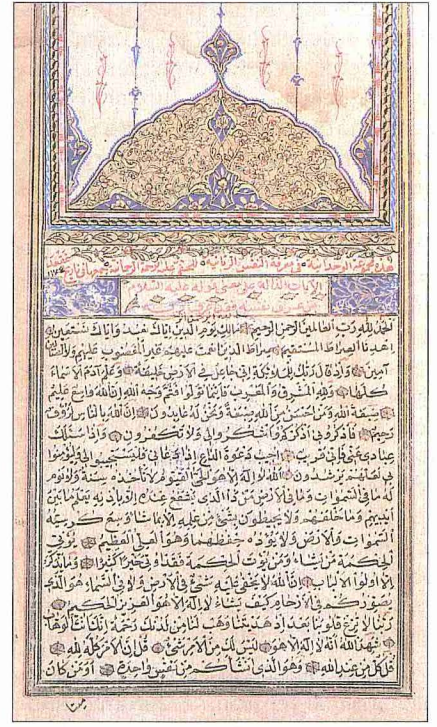
İbrâhim Hakkı Erzurumî'nin Mecmûatü'l-vaḥdâniyye fî ma'rifeti'n-nefsi'r-rabbâniyye adlı eserinin ilk sayfası (Süleymaniye Ktp., Hacı Mahmud Efendi, nr. 2412)

da 1180'de (1766) yazıldığı dışında bilgi yoktur. 14. Nuhbetü'l-keḷâm. 1182'de (1768) Mecmûatü'l-meânî ve Ma'rifetnâme 'den yapılan alıntılarla oluşturulduğu müellifi tarafından bildirilen bu eser de halen elde bulunmamaktadır. 15. Ülfetü'l-enâm. Yine müellifin 1189'da (1775) Ma'rifetnâme 'den alıntı yaparak düzenlediğini belirttiği eser (İbrahimhakkioğlu, s. 72) günümüze ulaşmamıştır.