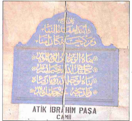
İbrâhim Paşa Camii'nin kitâbesi

İbrâhim Paşa Camii dikdörtgen planlı, dış cepheleri muntazam işlenmiş kesme taşla kaplanmış büyük ve güzel bir yapıdır. İçten ölçüleri 15,60 × 18,60 metredir. Tam bir kare olmadığına göre aslında kâgir kubbesi bulunmadığı sonucuna varmak mümkündür. Ancak esasında kubbeli düşünüldüğü ve içindeki sütunlara dayanan mahfillerle kubbeli olarak planlandığı, fakat kurucusunun vefatı üzerine binanın bezemeli ahşap bir kubbe ve çatı ile örtüldüğüne de ihtimal vermek mümkündür. Caminin girişindeki son cemaat yeri son tamirde ihya edildiği biçimiyle cephede altı, yanlarda birer sütunludur. Sivri kemerlere oturan bu sütunların başlıkları orijinal olmadığı gibi kubbeli olarak yenilenen son cemaat yerinin üstü de aslında çatılı olmalıdır. Esasen Lorichs'in resminde de camiyle birlikte son cemaat yeri, dört tarafa meyilli çok yüksek ahşap bir çatı altına alınmıştır. Hatta çatı yanlarda son cemaat yerinden taşmaktadır. Son cemaat yerinin mevcut