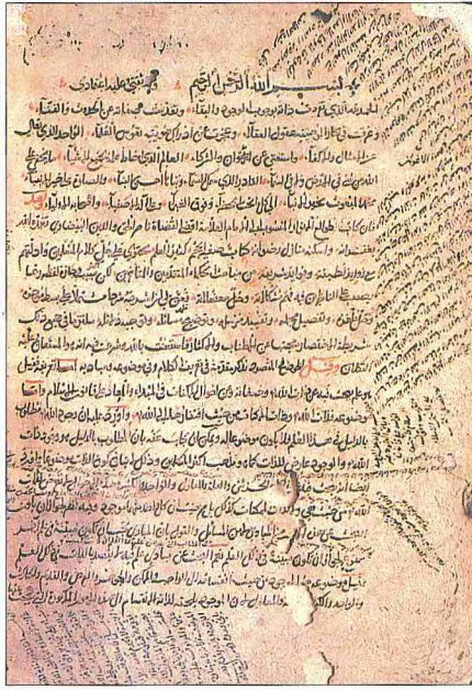
İbrî'nin Şerhu Tavâli'î-l-envar min metâli'î-l-enzâr adlı eserinin ilk iki sayfası (Süleymaniye Ktp., Şehid Ali Paşa, nr. 1656)