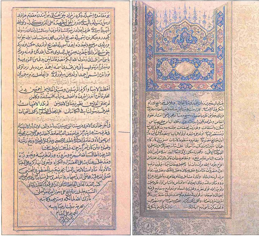
İbşîhî'nin el-Müsteṭraf adlı eserinin Lübbî Mehmed Efendi tarafından Esne't-tuhaf fi tercemeti'l-Müsteṭraf adıyla Türkçe'ye tercüme edilen nüshasının ilk ve son sayfaları (Nuruosmaniye Ktp., nr. 3737)

ön plana çıktığını, kendisinin ise yukarıdaki türlerin en güzel örneklerini bir araya getirdiğini söyler. İbşîhî eserini hazırlarken İbn Abdürabbih'in el-İkdü'l-ferîd 'i ile Zemahşerî'nin Rebî'u'l-ebâr 'ından faydalandığını ifade eder. Ancak eseri diğer bazı kaynaklarla karşılaştırıldığında onun adını zikretmediği başka eserlerden de yararlandığı anlaşılır. Mes'ûdî'nin Mürûcü'z-zeheb 'i, Ebû Ali el-Kâfî'nin el-Emâlî'si , Ebû Nuaym el-İsfahânî'nin Hilyetü'l-evliyâ 'ı, İbn Ebû Rendeke et-Turtûşî'nin Sirâcü'l-mülûk 'ü, İbn Hamdûn'un et-Tezkiretü'l-Hamdâniyye 'si, Ebû'l-Ferec İbnü'l-Cevzî'nin Telkîhu fûhûmi ehli'l-eşer 'uyûnî'l-târîh ve's-siyer', Edebü'l-ezkiyâ ' ve ahbâruhüm 'ü, İbn Seb'in'in Şifâ'u's-şudûr 'u, Zekerîyyâ el-Kazvî'nin 'Acâ'ibü'l-mahlûkât 'ı ve Demîrî'nin Hayâtü'l-hayevân 'ı bunlar arasında zikredilebilir. Müellifin, dönemindeki ansiklopedik eser yazma akımının etkisinde kalarak düzenlediği el-Müsteṭraf seksen dört bölüme ayrılmıştır. Kitabın muhtevasını şu başlıklar altında toplamak mümkündür: İslâm'ın esasları,