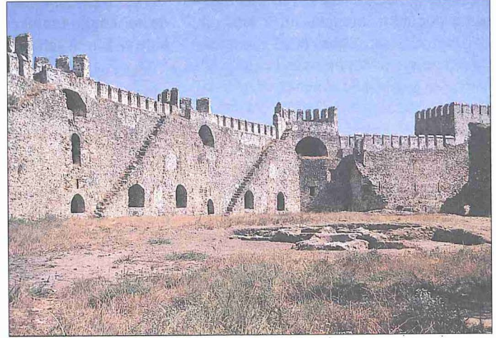
Mâmûriye Kalesi (Anamur / İçel) ve kalenin George Cooke tarafından çizilen gravürü (Beauford, s. 195)

olan vadilerde meyve başta olmak üzere çeşitli tarım ürünleri yetiştirilir. Gülnar ve Mut taraflarında geniş ölçüde bağ ziraatı yapılır. Sancağın tarım yönünden en elverişli yerleri Mut yöresidir. Mut dışındaki yerler, buğday ve arpa bakımından ancak kendilerine yetecek kadar ziraat yapmaktadır. Sancakta buğday ve arpadan sonra darı, susam, börtülce, burçak, mercimek ve çavdar ekilir; harnup, incir, nar, ceviz gibi meyveler yetiştirilir. Tarıma elverişli olan araziler, kıyı bölgelerinde özellikle Anamur ve Silifke ovaları ile bu ikisi arasında bulunan Aydınçık (Gilindire) çevresindeki ovalarda toplanmıştır. Bölgede ziraata elverişli alanlar XV. yüzyıldan itibaren artış göstermiştir. Öte yandan halkın toprağa yerleşmesiyle birlikte hayvancılık azalırken tarım işletmeleri çoğalmıştır.