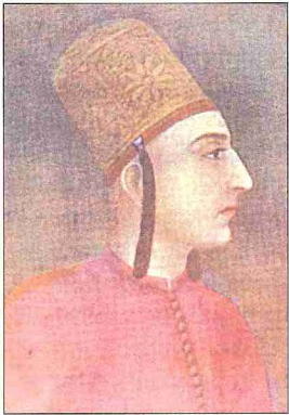
Bir iç oğlanı tasviri (TSM, Resim Dairesi, Teşhir, nr. 301)