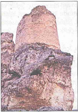
Mut yakınındaki Mavga Kalesi'nin günümüze ulaşabilmiş burçlarından biri – İçel

Diyanet İşleri Başkanlığı'na ait 1999 yılı istatistiklerine göre İçel'de il ve ilçe merkezlerinde 304, kasabalarda 200 ve köy-