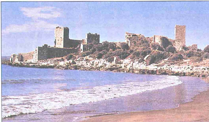
Korykos Kalesi – İçel

Tarihî Eserler. İçel sancağında, XV. yüzyıl başlarında içerisinde görevlilerin bulunduğu sekiz kale vardı. Kıbrıs adasının fethinden sonra Anadolu'da karayollarının denize ulaştığı iki noktada, eskiden mevcut olan kalelerin (Mâmûriye, Akça) ihyası ile İçel'deki kale sayısı on olmuştur. Sancakta harabe durumda Gilindire,