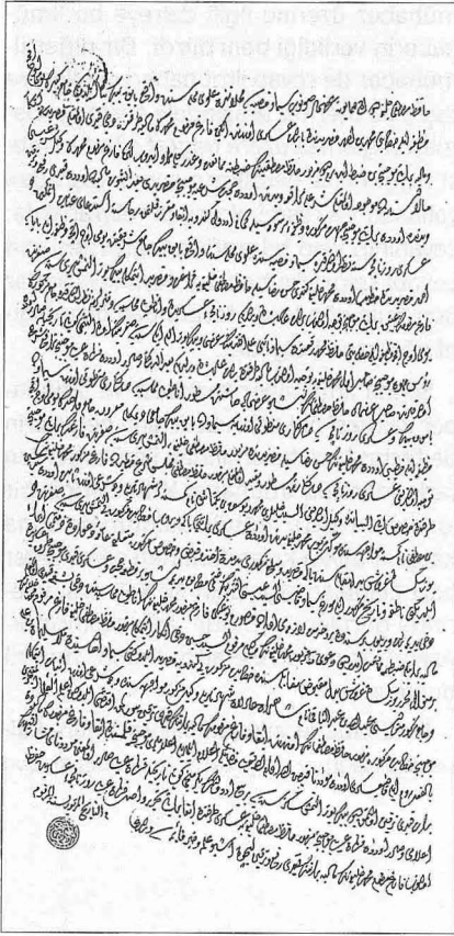
Askerî rûznâmeden verilen "sah" mühürlü ilmühaber kâimesi (BEO, A.DVN, Arz Dosya, nr. 1/36)

devirlerde "müzekkirelik" denilen orta boy kâğıtlara yazılmışken uzunlarda büyük boy "takirilik" kâğıt kullanılmış ve karnıyarık şeklinde, yani bir sayfaya iki sütun olarak kaleme alınmıştır.