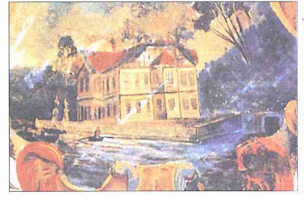
İmrahor Kasrı'nı tasvir eden, Kayserilli Ahmed Paşa Konağı'nın tavanına yapılmış resim

sı bulunuyordu. Eski haritalarda etrafı muntazam bir duvarla çevrilmiş olarak işaretlenen İmrahor Kasrı Sultan Abdülaziz tarafından, 1860'lı yıllarda Mimar Sarkis Balyan'a eski Sâdâbâd'ın yerinde Batı Avrupa sarayları üslûbunda Çağlayan Kasrı olarak adlandırılan yeni bir saray yaptırılırken temelden itibaren yeni baştan inşa ettirilmiştir.