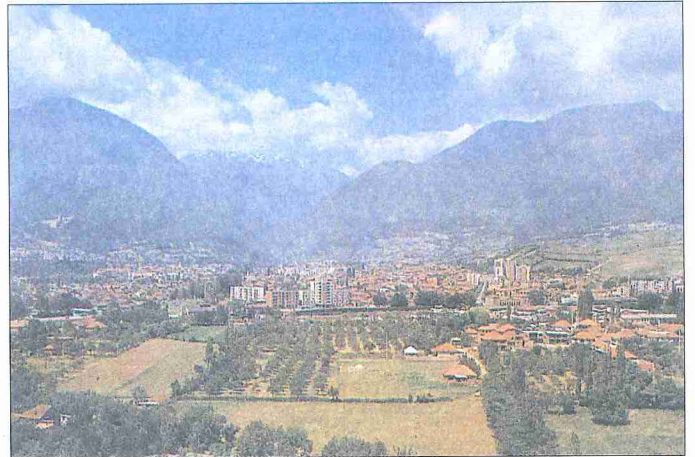
İpek'ten bir görünüşü - Kosova

XIX. yüzyılın ikinci yarısına ait Prizren vilâyeti ve daha sonra Kosova vilâyeti salnâmelerinde bir sancak merkezi olarak İpek hakkında geniş bilgi bulunmaktadır. 1291 (1874) tarihli salnâmeye göre kasabada 9981 müslüman, 814 Ortodoks, 387 Katolik hıristiyan ve 1025 Çingene vardı. 1829 ev, bir hamam, 525 dükkân, on bir cami, iki medrese, on iki mektep, sekiz han, bir kilise ve iki saat kulesi de