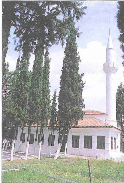
Çınarlı Camii - İskeçe