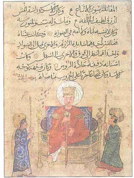
İbn Fâtik'in Muhtârü'l-hikem adlı eserinde İskender'in tasvir edildiği sayfa (TSMK, III. Ahmed, nr. 3206, vr. 119')

İskender, tahta çıkışından itibaren Pers İmparatorluğu ile hesaplaşma planları yapmaktaydı. Bu hususta gerekli hazırlıklar tamamlandıktan sonra kral nâibi olarak yönetimi Antipatros'a bırakıp 334 yılının ilkbaharında üstün donanıma sahip ordusuyla Asya seferine çıktı. Mimar, mühendis, tarihçi ve ilim adamlarından oluşan bir danışmanlar grubunu da birlikte götürdü. Pers ordularıyla ilk defa Grenikos'ta (Bigaçayı) karşılaştı ve onları yendi. İskender, bir yıl içinde Anadolu'yu ele geçirerek 333'ün sonbaharında İssos ovasında büyük bir Pers ordusuna kumanda eden III. Dârâ (Darius) ile karşılaştı; bozguna uğrayan Dârâ Bâbil'e kaçtı. Bu zaferden sonra Doğu Akdeniz sahillerindeki Fenike şehirleri zaptedildi.