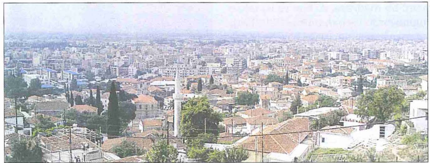
İskeçe'den bir görünüş - Yunanistan

Bazı eski kaynaklarda kasabanın Gazi Evrenos Bey tarafından 762 (1361) yılında ele geçirildiği kaydedilir. Modern çalışmalarda ise bu tarih 775 (1373) olarak gösterilir. İlk Osmanlı kroniklerinde de (Âşıkpaşazâde, Oruç, Neşri) farklı tarihler yer alır; Hoca Sâdeddin Efendi'nin Tâcü't-tevârih adlı eserinde 775 (1373) tarihi bulunur. Osmanlı fethi sırasında surları yıkılmış, tahribat görmüş ve bir köy statüsüne düşürülmüş olmasına rağmen birçok manastırıyla önemli bir hıristiyan merkezi olma özelliğini korudu. Osmanlılar, İskeçe'nin güneyindeki açık ovanın ortasına kurdukları yeni bir kasabayı, Yenice-i Karasu'yu merkez yaparak bölgeye büyük gruplar halinde Anadolu'dan Türk çiftçileri ve yörükleri getirtip yerleştirdiler. Nitekim 936 (1530) tarihli tahrir defterindeki kayıtlar, Yenice-i Karasu'nun nüfusunun üçte birinin hâlâ göçebe olduğunu gösterir. İskeçe ise bu kazaya baġlı en büyük meskûn mahaldi ve XIX. yüzyıla kadar da öyle kaldı. Bölge için günümüzde mevcut en eski Osmanlı tahrir defterinde (887/1482) "İsketye" adıyla yazılan kasabanın nüfusu, söz konusu yıllarda 345 hâne hıristiyan ve on dokuz hâne müslüman olmak üzere toplam 364 hâneye (yaklaşık 1500-2000 kişi) ulaşıyordu. Bunun hemen ardından kasaba Edirne'deki II. Beyazıt Külliyesi'nin vakfına dahil