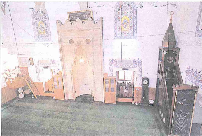
İskender Paşa Camii'nin içinden bir görünüşü

Kenarında ders ve kurs odaları mevcut olan avlunun ortasındaki şadırvan yeni olup sekiz sütunün desteklediği bir saçığa sahiptir. Caminin solundaki bahçede ufak bir hazîre ve uzun süre bu caminin