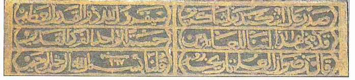
İskender Paşa Camiî'nin inşa kitâbesi

Günümüzde kiremit kaplı bir çatıya sahip olan caminin harim kısmı "çubuklu" tâbir edilen türde ahşap bir tavanla örtü-