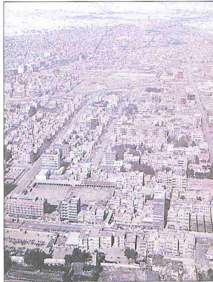
Tahran'dan bir görünüş