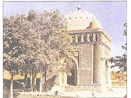
İsmâ'il b. Ahmed'in türbesi - Buhara