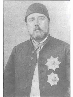
Hidiv İsmâil Paşa

İsmâil Paşa vali olur olmaz âdet olduğu üzere huzura çıkmak için İstanbul'a gitti. Buharla işleyen özel yatını hediye ettiği Sultan Abdülaziz'i Mısır'a davet etti. Diğer devlet erkânına da çeşitli hediyeler dağıttıktan sonra İstanbul'da iyi intibalar bırakmış olarak Mısır'a döndü. Abdülaziz'in 1863'te Mısır'ı ziyareti sırasında muhteşem karşılama törenleri, eğlence ve ziyafetler tertip ederek göze girmeyi başardı. Padişah'tan elde ettiği ilk önemli imtiyaz, Mısır veraset usulünü kendi nesli lehine değiştirmek oldu. 13 Muharrem