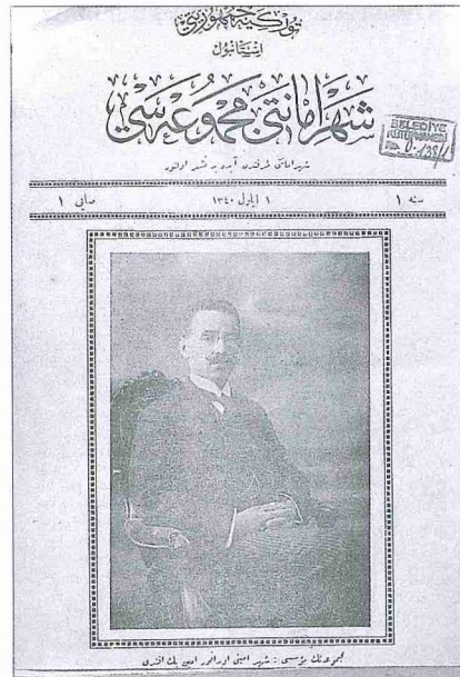
İstanbul Şehremâneti Mecmuası'nın ilk sayısının kapağı