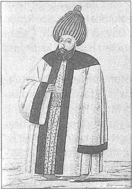
İstanbul kadısını tasvir eden bir resim (Ârif Mehmed Paşa, Mecmûa-i Tesâvir-i Osmâniyye , İstanbul 1279)

Şehremânetinin kurulması, 1876 anayasasındaki hükümler ve 1908 tarihi, İstanbul kadılığının yetkilerinin sınırlandırılmasında birer dönüm noktası olmuş ve II. Meşrutiyet döneminde Adliye Nezâreti'ne bağlı bir mahkemeye dönüşmüştür. Ancak İstanbul kadılığı pâyesi Osmanlı Devleti'nin sonuna kadar ilmî pâye olarak kalmıştır. 1334 (1916) tarihli İlmiyye Salnâmesi 'nde İstanbul pâyeli otuz beş âlimin ismi ve memuriyeti sıralanmıştır (s. 59-61).