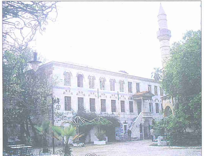
Gazî Hasan Paşa Camii / İstanköy

Güvenli limanı ve muhkem kalesiyle Osmanlı donanmasının önemli deniz üslerinden biri haline gelen İstanköy, bu özelliğini 1570'lerden sonra Akdeniz'deki yeni gelişmeler sonucu kazandı. Yoğunlaşan deniz harekâtları sebebiyle bir ara Nakşe (Naksos) sancağına bağlandı. Ardından yeniden Rodos'a katıldı (989/1581). XVII. yüzyılda önemi giderek arttı. Sağlam kalesi ve limanı sebebiyle tüccar gemilerinin uğrak yeri oldu. Bazı seyyahlar, korsanların uğrayamadıkları bu adanın İstanbul-Mısır ticaret gemileri için güvenilir bir liman olduğunu belirtirler (Randolph, s. 23-24). 1082 Cemâziyelevvelinde (Eylül 1670) burayı gören Evliya Çelebi'ye göre kale içinde 300 (?) ev vardı. Kale kapısının iç tarafında kiliseden çevrilmiş minaresiz Sultan Süleyman Camii bulunuyordu. Varoş ile kale arasındaki Lonca meydanı antik özelliğe sahipti. Kalenin hemen dışında olan bu kesimde 1200 hâne mevcut olup bunların ellisi Türkler'e aitti. Hıristiyanların ise her biri birer mahallenin merkezi olan sekiz kilise ve 900 hâneleri bulunuyor, ayrıca bir yahudi topluluğu da yer alıyordu. Bu kısmın iki kapısı vardı, gemiler bu kapılardan İskele Kapısı önlerine yanaşıyorlardı, gümrük de buradaydı. Diğer kapının (Yalı Kapısı) batısı asil büyük varoşa açılmaktaydı. Et-