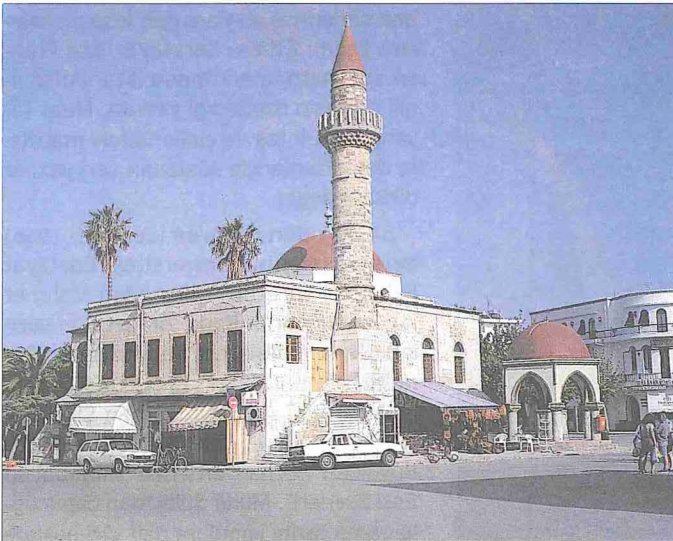
Defterdar İbrahim Efendi Camii - İstanköy

Yerleşme tarihi antik dönemlere kadar inen adaya Dorlar'ın yerleştiği ve buranın milâttan önce V. yüzyılda Delos birliğine katıldığı belirtilir. Bu yüzyılda eski Yunan'daki ilk tıp okulunun burada açıldığı rivayet edilir. Hatta burası Hipokrat'ın yaşadığı yer olarak ün kazanmıştır. Milâttan