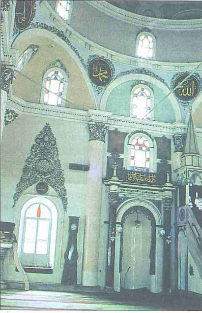
Kemeraltı Camii'nin içinden bir görünüşü

Âbidevî camilerin büyük çoğunluğu merkezî sistemde yapılmıştır. Kesin inşa tarihi bilinmemekle birlikte şehrin âbidevî ilk yapısı kabul edilen Hisar (Yâkub Bey) Camii 1813, 1870, 1881, 1890 ve 1927 yıllarında onarılmıştır. Merkezî kuruluştaki harimle kuzeyindeki yedi kubbeli son cemaat yeri ve minareden oluşur. Harimde mihrap önündeki büyük kubbeli kare hacim üç yönden daha küçük kubbeli hacimlerle kuşatılmıştır.