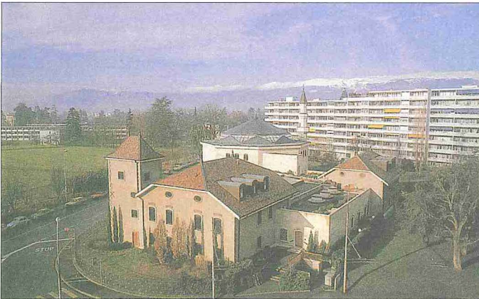
Cenevre İslâm Merkezi'nin genel görünüsü

Müslümanların İsviçre ile ilk temasları, X. yüzyılda Endülüs Hükümdarı III. Abdurrahman zamanında meydana geldi. Müslüman askerî birlikleri, bugün İsviçre'nin güney sınırında kalan Cenevre gölünden itibaren Valais, içerideki Grisons (Graubünden) ve Coire'nin bulunduğu bölgelere ve Almanya sınırında yer alan Constance gölünün yakınındaki Saint Gall'e kadar ilerledilerse de kalıcı yerleşim yerleri kuramadılar. İsviçreli'lerin İslâm dünyasıyla temasları ise Haçlı seferleri ve 1798'de Napolyon'un Mısır seferine verdikleri askerler vasıtasıyla olmuştur. Kurumsal anlamda müslümanların bu ülkedeki ilk faaliyeti, Kâdiyânîlik (Ahmediyye) hareketinin bütün Avrupa'daki faaliyetlerini yürütmek amacıyla XX. yüzyılın ortalarında Zürih'te bir merkez oluşturmasıyla gerçekleşti; burada bulunan ve ülkedeki ilk cami olarak kabul edilen Mahmud Camii'ni de bu hareket inşa etmişti (1963). 1960'lı yıllarda Türkiye ile diğer İslâm ülkelerinden gelen müslüman işçiler İslâm dininin İsviçre'de tanınma-