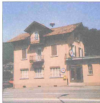
Türk-İslâm Derneği'ne ait Aarburg'daki Olten Mescidi ile Solothorn Fâtih Mescidi - İsviçre