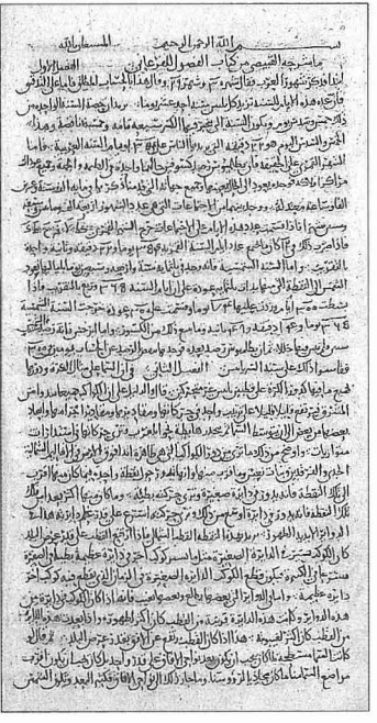
Kabîsî'nin Şerḥu Kitâbi'l-Fuṣûl li'l-Fergânî adlı eserinin ilk ve son sayfaları (Süleymaniye Ktp., Ayasofya, nr. 4832/16)