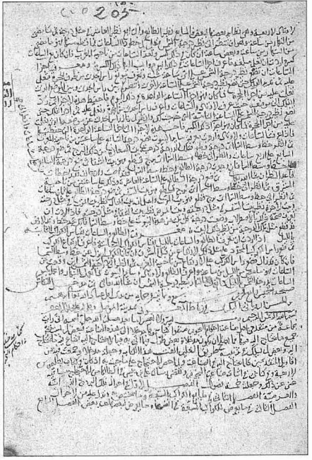
Kabîsî'nin el-Medhal ilâ şınâ'ati aḥ-kâmi'n-nücüm adlı eserinin ilk iki sayfası (Süleymaniye Ktp., Fatih, nr. 3439/20)

leri, beşinci bölümü de konularına göre yıldız falı tahminleri hakkındadır. Türkiye ve dünya kütüphanelerinde çok sayıda yazma nüshası bulunan eser (meselâ bk. Süleymaniye Ktp., Fatih, nr. 3439/20, vr. 205 a -217 a , Yazma Başşıklar, nr. 1342, Hamidiye, nr. 856/2, vr. 89 a -114 b ; diğer yazmaları için bk. Brockelmann, I, 399; King,