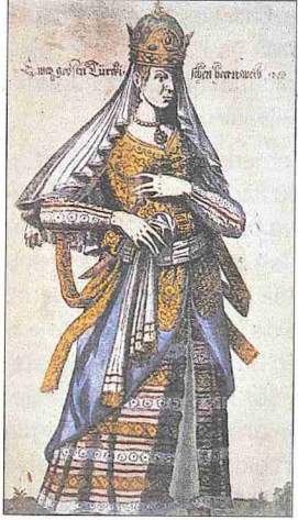
XVI. yüzyıla ait bir hasaki sultan gravürü (Gürtuna, resim 29)

mum, sabun, odun, kömür, şeker, kahve, et, yağ, kar, kaymak, ekme, bal, yumurta, meyve ve sebze gibi aynı veya nakdî olabiliyordu. Ayrıca kendilerine haslar ve paşmaklıklar tahsis edilirdi. II. Mahmud döneminin sonlarından itibaren kadınefendilere diğer devlet memurları ve saray mensupları gibi maaş bağlandı. Maaşları Hazîne-i Hâssa'dan ödenirdi. Bayram, düğün, doğum gibi vesilelerle dağıtılan aynı ve nakdî hediye ve atıyyelerden de payları olurdu. Önceki devirlerde dağıtılan hediye ve tahsisatlar kadınefendilerin derecelerine göre farklıydı; yani başkadin daha fazla, diğerleri derecelerine nisbetle daha az alırdı. Ancak maaş tahsisinden sonra hepsinin maaşı eşit düzeye getirildi. Öldüklerinde mallarına ve muhalefatına hazine adına el konulurdu.