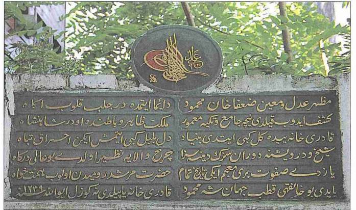
Kâdirihâne Tekkesi'nde basamaklı yolun duvarındaki ihya kitâbesi

Son cemaat yerinin doğu ucunda meydan odası olarak kullanılan çepeçevre sedirlerle donatılmış küçük bir mekân, bunun da arkasında 1177 (1763-64) tarihli çeşmeyi barındıran çeşmeli sofa bulunur. Çeşmeli sofanın güney yönündeki bahçıvan odaları arasından selâmlık bahçesine geçilebildiği gibi doğu yönündeki kapıdan, gerisinde mutfak-yemekhane kanadının yer aldığı şadırvanlı avluva da ulaşılır. Son cemaat yeriyle harim arasında ve girişin solunda (doğu) yan yana iki hal-