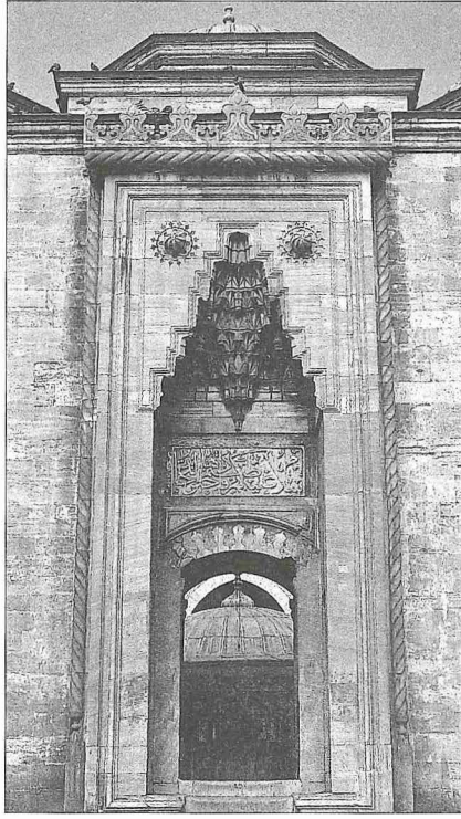
Beyazıt Camii avlusunun ana kapısı

olan girişler de vardır ki bunlara "derveze" ismi verilmektedir. Aynı şekilde taçkapı denilen düzenlemelerin benzeri girişlere Avrupa'da "portal" adı verilmektedir. Bunun gibi Osmanlı döneminde "cümle kapısı" tabiri de daha çok ana girişler (taçkapılar) için kullanılmıştır (bk. CÜMLE KAPISI).