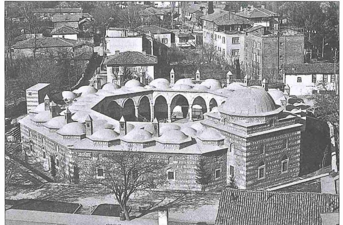
Kapı Ağası Medresesi – Amasya

Türk İslâm devletlerinde kapı kelimesi genellikle devleti ifade eder; bugün de devlet kapısında çalışmak "kamu hizmetinde olmak" şeklinde anlaşılır. Osmanlı-