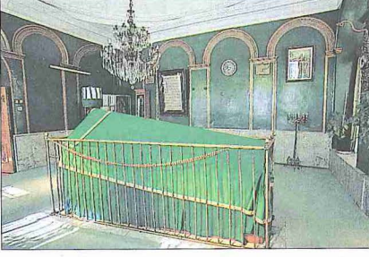
Karaca Ahmed'in sandukası

med'in ölümünden sonra şeyhlik ve ruh hekimliği vazifesini oğlu Eşref devam ettirmiştir. Ayrıca Hızır Abdal adında bir oğlunun daha olduğu bilinmektedir.