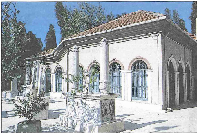
Karaca Ahmed Türbesi - Üsküdar / İstanbul