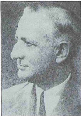
Refik Halit Karay

Galatasaray Mekteb-i Sultânîsi'nde okuyan, divan ve Tanzimat dönemi ede-