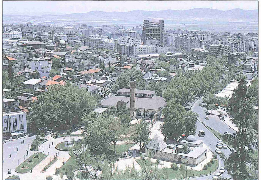
Kahramanmaraş Ulucamii ve Taşmedrese ile arka planda şehrin modern kesiminden bir görünüşü

□ MİMARİ. Arkeolojik verilerle kısmen aydınlatılmaya çalışılan şehrin ilk dönemleri hakkında fazla bilgi yoktur. Hareketli geçen tarihî seyir içerisinde VII. yüzyıldan XIV. yüzyıla kadar bu çevrede kuvvetli bir mimari geleneğin kurulamadığı, mevcutların da sık sık el değiştirme, istilâ, talan