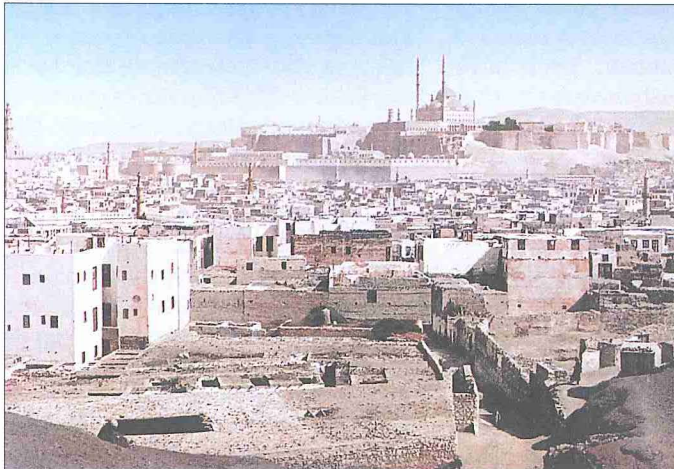
XIX. yüzyıl sonunda Kahire'den bir görünüş (İÜ Ktp., Albüm, nr. 90565)

Osmanlı Kahiresi hakkında çeşitli araştırmacılar tarafından genellikle olumsuz fikirler ileri sürülmüştür. Bu husus, Osmanlı dönemiyle ilgili küçümseyici bir tavır yansıttığı kadar Osmanlı Kahiresi'nin Memlûkler'e ait metropol ve onun âbidevî azametiyle karşılaştırılmasından kaynaklanmaktadır. Mercel Clerget klasikleşmiş eserinde, "Şehir anlaşılabilir bir şekilde yavaş yavaş sönüyor, ölmeye yüz tutuyor. Şaşaalı mâzisinin kalıntıları yıkılmaya terk ediliyor" demektedir ( Le Caire , I, 178). Söz konusu fikirleri doğrulamak için çeşitli deliller de sıralanmıştır. Bunlara göre Kahire, bütün Ortadoğu'yu kaplayan bir sultanlığın başşehri iken bir eyaletin merkezi durumuna indirilmiş, böylece gelir kaynakları küçülmüş ve sonraki yıl-