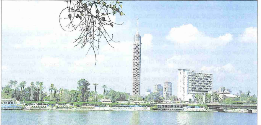
Nil nehri ve Cîze'den bir görünüşü

Enver Sedat döneminde takip edilen politika Kahire'deki nüfus artışını daha da hızlandırdı. Yerleşim alanlarının yetersiz kalması plansız şehirleşme ve gecekondulaşmayı beraberinde getirdi. Kahire'nin çevresinin çöllere kaplı olması buraya mahsus bir düzensiz yerleşmeye yol açtı. Gelir seviyesi düşük çok sayıda insan binaların çatılarını mekân edinirken şehrin içinde kalan mezarlıklar da büyük bir mezar-kente dönüştü; buralarda yaşayanların sayısı milyonla ifade edilmektedir. Ayrıca boş bulunan her yere kurdukları barakalarda yaşayanların sayısı da gittik-