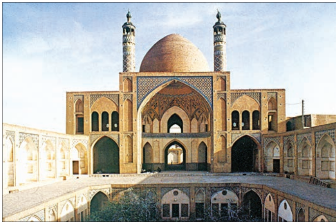
Kaçarlar dönemine ait Mescid-i Ağâ Büzürg ve Medresesi – Kâşân / İran

Kâşân çevresi İslâm öncesi kalıntıları bakımından çok zengindir; şehrin güneybatısında bulunan Tepe Siyâlk harabeleri ve Sâsânîler'e ait eski kale ile Neyâser'deki ateş tapınağı bunlar arasındadır. Şehirdeki İslâmî yapıların en önemlilerinden biri Selçuklular zamanında inşa edilen Mescid-i Câmî ve minaresidir (466/1074). büyük depremde hasara uğramış ve 1207'de (1792) köklü bir onarım görmüştür. Diğer iki Selçuklu eseri Penç-i