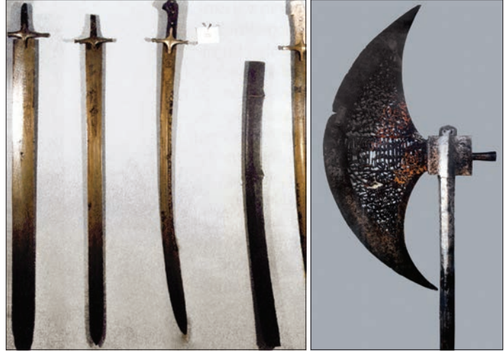
Kayıtbay'ın Topkapı Sarayı Müzesi'ndeki kılıçları ve baltası

Kaynaklarda âdil, cesur, ileri görüşlü, ilme ve ilim adamlarına değer veren bir hükümdar olarak tanıtılan Kayıtbay pek çok imar hareketinde bulunmuştur. Ülkesindeki maddî sıkıntılara rağmen Mısır, Hicaz ve Suriye'de pek çok cami, medrese, tekke, köprü ve kale inşa ettirmiştir. Yangın geçiren Mescid-i Nebevî'yi yenilemiş, Mekke ve Medine'de Harem'e bakan birer medrese yaptırmıştır. Bu eserlerden bazıları günümüze ulaşmıştır. Bunlar arasında özellikle türbesinin de içinde bulunduğu Kahire kapısındaki camisi en tanınmış olanıdır. Bu külliye, sadece Memlûk mimarisinin değil aynı zamanda İslâm mimarisinin en güzel örneklerinden sayılır (bk. KAYITBAY KÜLLİ-