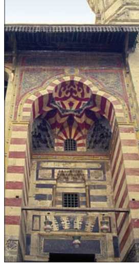
Kayıtbay Camii'nin taçkapısı

Taştan olan mihrapta, taçkapının kavsarasında görülenlere benzeyen renkli taş kakma süsleme şemaları vardır. Kapalı avlunun köşelerindeki girintiler pencerelerle donatılmış, mızrak ucu biçiminde kemerlere sahip nişlerle süslüdür. Bir kitâbe kuşağı merkezî hacmin üst kısmını çevreler. İbadet mekânının güney yönündeki türbe taştan mâmul, panolarla bezeli, oymalı ve boyalı bir mihraba sahiptir. Kubbenin taş pandantiflerindeki sarkıtlar da oymadır. Her ne kadar vakfiyede sûfiler ve vakfa bağlı diğer kişiler için çeşitli bölümlerden söz ediliyorsa da bu barınma birimlerinin hiçbiri günümüze ulaşmamıştır.