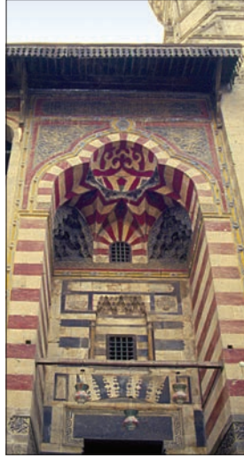
Kayıtbay Camii'nin taçkapısı

Taştan olan mihrapta, taçkapının kavsarasında görülenlere benzeyen renkli taş kakma süsleme şemaları vardır. Kapalı avlunun köşelerindeki girintiler pencerelerle donatılmış, mızrak ucu biçiminde kemerlere sahip nişlerle süslüdür. Bir kitâbe kuşağı merkezî hacmin üst kısmını çevreler. İbadet mekânının güney yönündeki türbe taştan mâmul, panolarla bezeli, oymalı ve boyalı bir mihraba sahiptir. Kubbenin taş pandantiflerindeki sarkıtlar da oymadır. Her ne kadar vakfiyede sûfiler ve vakfa bağlı diğer kişiler için çeşitli bölümlerden söz ediliyorsa da bu barınma birimlerinin hiçbiri günümüze ulaşmamıştır.