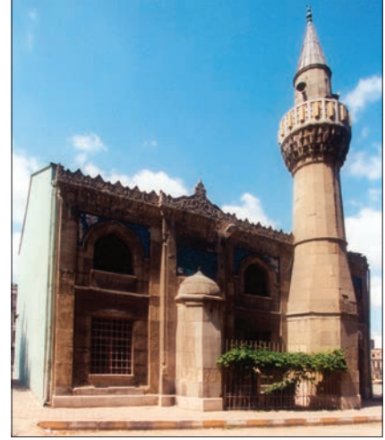
Kamer Hatun Camii – Tarlabası / İstanbul

(1927), Ankara Devlet Demiryolları Genel Müdürlüğü (1927-28), Ankara Gazi Eğitim Enstitüsü (1927-30), Ankara'da I ve II. Vakıf hanları (1926-30), Ankara Yenışehir'de mektep (Ağustos 1925'ten sonra), Ankara'da Mimar Kemâleddin Okulu (Ağustos 1925'ten sonra), Belvü Palas (Ağustos 1925'ten sonra), Amerikan Sefâreti (Ağustos 1925'ten sonra). Mimar Kemâleddin'in gerçekleştirdiği önemli tamiratlar da İstanbul Yenicami, Sultan Ahmed, Ayasofya ve Fâtih külliyesiyle 1922-1925 yılları arasında Mescid-i Aksâ ve Kubbetü's-sahre'nin tamiratıdır.