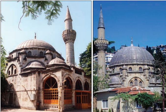
Mimar Kemâleddin Bey'in eserlerinden Bakırköy Kartaltepe'deki Âmine Hatun Camii ile Bebek Camii – İstanbul