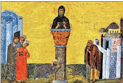
X. yüzyılın sonlarında Bizans İmparatoru II. Basileios için hazırlanan Menologion 'un içindeki bir minyatürde sütun üzerinde keşiş hayatı yaşayan Aziz Simeon Stylites'in tasviri