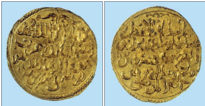
III. Keyhusrev adına basılan altın sikke (Yapı ve Kredi Bankası koleksiyonu, nr. 9632)

I. Gıyâseddin Keyhusrev ölünce (608/1211) devlet erkânı Konya'da toplanarak sultanın en büyük oğlu olduğu için Malatya Meliki İzzeddin Keykâvus'un Selçuklu tahtına çıkarılmasına karar verdi ve Kayseri'ye gelmesi için kendisine ulak gönderdi. Keykâvus Sivas - Kayseri arasındaki Gedük'te (Şarkışla) karşılandı. Biat, yas ve tahta çıkma törenleri Kayseri'de yapıldı. Ancak Kayseri'den Konya'ya hareket edileceği sırada sultanın kardeşi Tokat Meliki Alâeddin Keykubad'ın saltanat davasıyla ortaya çıktığı ve şehre doğru gelmekte olduğu haber alındı. Alâeddin Keykubad şehri kuşattı, çok geçmeden Erzurum Meliki Mugisüddin Tuğrul Şah ile Ermeni Kralı II. Leon da kuşatmaya katıldı. Meselelerin savaşıla halledilemeyeceğini anlayan devlet adamları diplomatik yola başvurular. Kayseri subaşı Celâeddin Kayser para ve değerli hediyelerle Ermeni Kralı II. Leon'a gönderildi. Celâeddin, Leon'a geri döndüğü takdirde kendisine 1200 müd tahıl verileceğini, işgal ettiği Luluva (Ulukışla), Ereğli ve Lârende'nin de (Karaman) ona ait olacağını bildirdi. Leon bu teklifi kabul edip ülkesine döndü. Eyyübî Hükümdarı el-Melikü'l-Eşref'in Keykâvus tarafından yardıma çağrıldığını duyan Tuğrul Şah da gizlice Erzurum'un yolunu