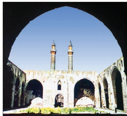
Keykâvus Dârüşşifâsı ana eyvanından avlunun görünüşü

Dârüşşifânın avlu cephelerindeki süslemeler, ana eyvanın sivri kemerini dolanan bitkisel bezemeli bordürle iki yandaki geometrik geçmeli bordür olarak görülmektedir. Yüksek kabartma biçiminde iki