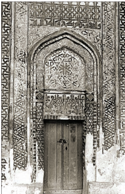
İzzeddin Keykâvus Türbesi'nin kapısından bir detay

Batu Han'dan sultana hükümdarlık alâmeti olarak hil'at, ok ve yay getiren heyet döndükten kısa bir süre sonra mevki mücadeleleri başladı. Bu esnada Moğol elçileri gelerek İzzeddin Keykâvus'un,