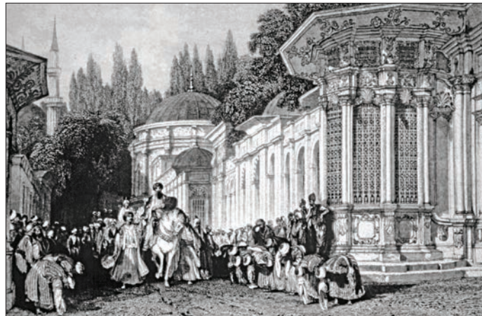
Allom'un bir gravüründe Eyüp'te kılıç alayı (R. Walsh, Constantinople and the Scenery of the Seven Churches of Asia Minor , London 1839, I, lv. XXIII)