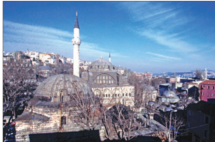
Kılıç Ali Paşa Külliyesi – Tophane / İstanbul

"Koca kaptan" olarak da anılan Kılıç Ali Paşa İstanbul Tersanesi'nin genişletilmesinde, donanma gemilerinin daha büyük ve gösterişli yapılmasında rol oynamış, kürek çekmeyi kolaylaştıracak ve hızlandıracak bazı değişiklikler yapmıştır. III. Murad adına tersanede kendi modeliyle büyük bir başardanın inşasına teşebbüs ederek onun iltifatına mazhar olmuştur. Anavarin Limanı'nın girişine sağlam bir kale yaptırmış, top ve asker yerleştirerek bölgenin korunmasını sağlamıştır. 990'da (1582) Şehzade Mehmed için düzenlenen sünnet merasimi için binlerce forsanın yapımında çalıştığı tahtadan yapılmış temsilî bir dağ getirtmiş, töreni seyretmek amacıyla yaptırdığı muallimhâne tarzındaki evi de daha sonra çocukların eğitimi için vakfetmiştir (İntizâmî, s.