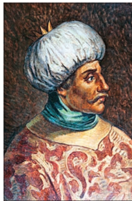
Kılıç Ali Paşa'yı tasvir eden yağlı boya tablo (İstanbul Deniz Müzesi)