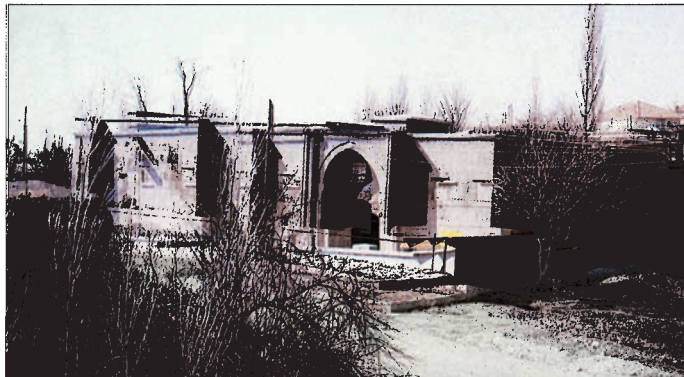
Kesikköprü Kervansarayı – Kırşehir