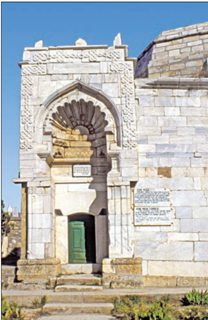
Aşık Paşa Türbesi'nin taçkapısı

Karaman eyaletine bağlı sancaklık statüsünü uzun süre devam ettiren Kırşehir, Tanzimat'ın ilânıyla birlikte oluşturulan ve 1842'de kaldırılan muhassıllık uygulaması esnasında Konya eyaletine bağlı kaldı. Bu uygulama ile ilgili kayıtlarda Kırşehir'in bir ara Niğde muhassıllığına bağlı olduğu, bir ara da muhassıllık haline getirildiği zikredilir (Çakır, s. 47, 241). 1867 Vilâyet Nizamnamesi'ne göre Konya vilâyetinin Niğde sancağına bağlı kaza idi. Daha sonra sancak haline getirildi. Konya vilâyetinden alınarak Ankara vilâyetine bağlandı. 1294'te (1877) sancağın merkez Kırşehir ile birlikte Avanos, Keskin ve Mecidiye (Çiçekdağı) adlı dört kazası vardı. 1892 yılında Kırşehir sancağı bu dört kazadan başka Hacibektaş ve Mucur nahiyelerine sahipti. 1914'te merkez Kırşehir