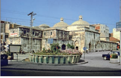
Hızır Bey Arastası ve Hamamı – Kırklareli

Kırklareli önemli bir zirai merkez özelliğini sürdürmektedir. Şehirde sanayi kuruluşu olarak ana maddesini tarımsal ürünlerden alan sanayi kolları (peynir ve ayçiçek yağı imalâthâneleri, yem üretimi, mübâdeleden önceki önemini yitirmiş olan şarapçılık vb.) sayılabilir. Ticaretin gelişmesinde 1971'de açılan, Bulgaristan'la ve onun aracılığıyla Romanya ile ilişkiyi sağlayan Dereköy sınır kapısının etkisi sezilebilmektedir (bu kapıdan 1996 yılında toplam 218.816 kişi ve 25.621 araç giriş yapmış, 21.719 araç da çıkmıştır).