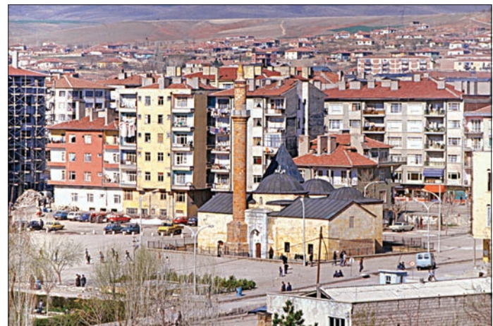
Ahî Evran Zâviyesi ve Türbesi ile yakın çevresinden bir görünüş

992'de (1584) şehirdeki mahalle sayısı on yediye yükseldi. Bu durum şehrin XVI. yüzyıl süresince fizikî açıdan daha da geliştiğini gösterir. 1526-1584 yılları arasında teşkil edilen yeni mahalleler Yenice, Cedîd (Kayabaşı), Cedîd (Lala Camii), Ta-bağıl, Alaybeyi, Şeyh Süleyman Sofu, Cedîd (Kıllık) ve Şarkıyan adını taşımaktaydı. Bu mahallelerden Kayabaşı, Lala Camii