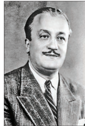
Necip Fazıl Kısakürek