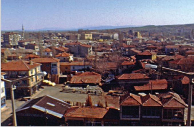
Kırşehir'den bir görünüş

idareye giden vergi gelirini 57.000 dinar olarak vermektedir ( Nüzhetü'l-kulûb , s. 99). XIV. yüzyıl ortalarında Eretna Beyliği'nin eline geçen şehir, Eretnaoğlu Mehmed Bey'in ölümünden (767/1366) sonraki iç karışıklıklar sırasında en fazla zarar gören yerlerden biri oldu. Ardından Sivas merkez olmak üzere bir devlet kuran Kadı Burhâneddin'in idaresine girdi (791/1389). Kadı Burhâneddin, Osmanlı ve Karamanoğulları sınır kesiminde yer alan şehrin surlarını tamir ettirdi. Timur'un Anadolu'ya ilk girişi sırasında Karamanoğulları tarafından yağma edilen şehir Kadı Burhâneddin'in ölümünden (800/1398) sonra Osmanlılar'ın eline geçti. Ankara Savaşı'nın (804/1402) ardından Timur tarafından Karamanoğulları'na verildi. Timur Anadolu'dan çekilirken başta Yozgat çevresi olmak üzere Kırşehir yöresindeki Moğol aşiret gruplarının önemli bir kısmını götürdü ve onlardan boşalan yaylak ve kırsal mahallerine Dulkadiroğulları'na mensup konar göçer Türkmen grupları gelmeye başladı. Bu durum Kırşehir'in Dulkadiroğulları'nın idaresine girmesinde önemli rol oynadı. Kırşehir'de Dulkadir hânedanı mensupları yöneticilik yaptılar. Fâtih Sultan Mehmed döneminde Dulkadiroğlu Alâüddeve Bozkurt Bey Kırşehir'de bulunmaktaydı. Şehir muhtemelen Fâtih'in hükümdarlığının son yıllarında kesin olarak Osmanlı idaresine girdi. Osmanlı idaresinin ilk yıllarında Alâüddeve Bey'in haslarına dokunulmamıştı.