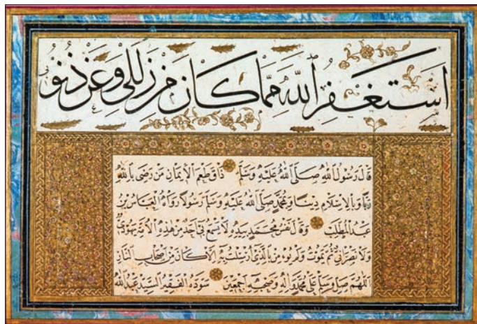
Seyyid Abdullah'ın sülüs - nesih koltuklu kitabı (İÜ Ktp., AY, nr. 6474)