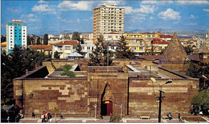
Huand Hatun Medresesi – Kayseri

V/4 (1947), s. 401-418; Ajun Kurter, "Orta Kızılırmak Bölümünde Şeker Pancarı Ziraati ve Kayseri Şeker Fabrikası", İÜ Coğrafya Enstitüsü Dergisi , sy. 9, İstanbul 1958, s. 137-141; Mehmet Çayırdağ, "Kayseri'nin Mahalleleri", Erciyes , sy. 38, Kayseri 1981, s. 5-9; Metin Tuncel, "Erciyes Üniversitesi'nin Dünü Bugünü", Yükseköğretim Bülteni , sy. 1, Ankara 1986, s. 49-53; Mehmet Somuncu, "Erciyes Dağında Turizm ve Spor", Melikgazi Belediyesi Dergisi , sy. 6, Kayseri 1992, s. 37; a.mlf., "Kayseri Şehrinin Kuruluşu ve Gelişmesi", AÜ Türkiye Coğrafyası Araştırma ve Uygulama Merkezi Dergisi , sy. 4, Ankara 1995, s. 127-146; a.mlf., "Kayseri'de Bağcılık", AÜ DTCF Coğrafya Araştırmaları Dergisi , sy. 11, Ankara 1996, s. 107-133.