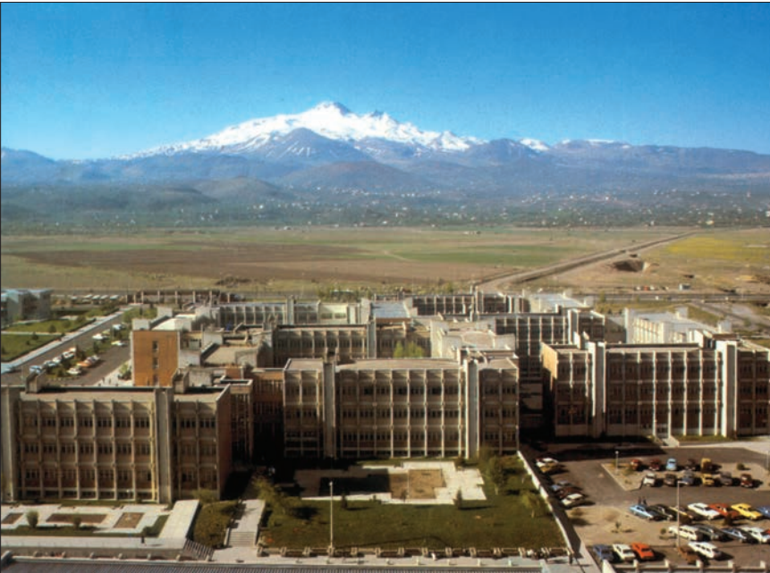
Kayseri'nin simgesi olan Erciyes dağı ile Erciyes Üniversitesi

G. Barstch, Das Gebiet des Erciyes Dağı und die Stadt Kayseri in Mittel-Anatolien , Hannover 1935; A. Gabriel, Kayseri Türk Anıtları (trc. Ahmed Akif Tütenk), Ankara 1954; Nahid Sırrı Örik, Kayseri, Kırşehir, Kastamonu , İstanbul 1955, s. 6-46; Metin Sözen, Anadolu Kentleri , İstanbul 1971, s. 263-267; Muhsin İlyas Subaşı, Dünden Bugüne Kayseri , İstanbul 1991; Mustafa Özdemir, Kayseri'de Pastırmacılık , Kayseri 1994; Vacit İmamoğlu, "20. Yüzyılın İlk Yarısında Kayseri Kenti: Fizikî Çevre ve Yaşam", I. Kayseri ve Yöresi Tarih Sempozyumu Bildirileri (11-12 Nisan 1996) , Kayseri 1997, s. 119-128; Rifat Önsoy, "Millî Mücadelede Kayseri", a.e., s. 230-235; Nevzat Türkten, "Kayseri'de Yanlış Şehirleşme ve Mahzurları", a.e., s. 351-355; Cumhuriyet'in 75. Yılında Kayseri , Kayseri 1998; Reşat İzbirak, "Kayseri Şehrinin İşleme ve Gelişmesinde Bağcılığın Etkileri", DTCFD ,