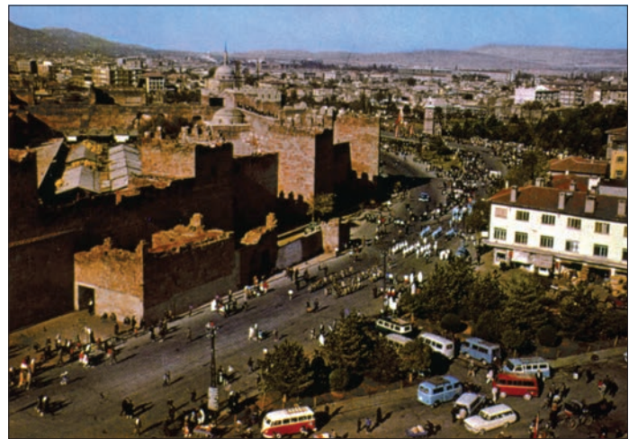
Kayseri'den bir görünüşü

Aynı dönemde, şehrin çekirdek kısmından uzakta kurulmuş olan sanayi tesisleri çevresindeki mahallelerle şehrin merkezi arasındaki boşluklar dolmaya başladı. 1950'den sonra hızlanan imar faaliyeti kapsamında yeni imar edilen yerlerden başka, iç kalenin güneyinde yer alan eski mahallelerdeki binalar yıkılıp bunların yerine birbirini dik olarak kesen caddeler üzerinde planlı iş merkezi oluşturuldu. Surların kuzeyinde bulunan seyrek dokulu mahallelere de el atılarak büyük apartman blokları inşa edildi. Şehir dokusundaki önemli değişikliklerden bir diğeri 1956 yılında şehrin batısındaki sanayi sitesinin kurulmasıdır. Çorakçılar yazısı denilen boş alanda ilk defa düzenli ve planlı bir sanayi sitesi oluşturulunca şehrin merkezi kesiminde bulunan küçük atöl-