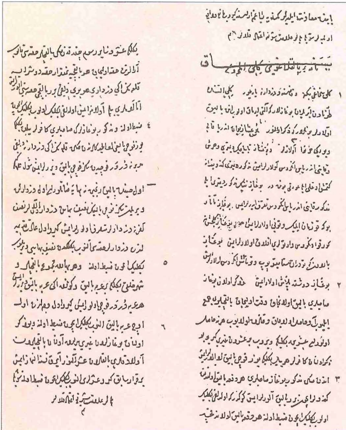
Kili balık yasaknâmesi (TSMK, Revan Köşkü, nr. 1935, vr. 122 a -122 b )

Kili sancağı, XVI. yüzyılın ikinci yarısında gittikçe artan Kazak tehlikesi tehdidinden dolayı kaza haline getirilerek Rumeli beylerbeyliğine tâbi Akkırman sancağına bağlandı. XVII. yüzyıl başlarından