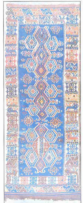
Konya yöresinde dokunmuş, bereket, eli belinde, kaz ayağı, koç motifleri taşıyan XIX. yüzyıla ait kilim (İstanbul Vakıflar Halı ve Kilim Müzesi)

En eski yaygılar dokunuşlarındaki koçluk ve basitlik sebebiyle kilim türünde