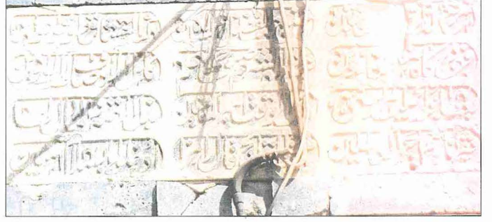
Kilis Mevlevîhânesi'nin kitâbesi

kubbe eteğinde gördüğü 1308 (1890) tarihinden kubbenin bu tarihte bir onarım geçirdiği tahmin edilebilir. Ancak tamir keşifleri elde bulunmadığı için semâhânenin orijinal mimarisinin bu onarımlarda ne derece değiştirildiği tam olarak bilinmemektedir. Halep Mevlevîhânesi semâhânesinin plan şeması ve cephelerinin Kilis Mevlevîhânesi semâhânesinininkine benzeri her iki işte de aynı ustaların çalışmış olabileceğini düşündürmektedir. Aynı durum XIX. yüzyılda da tekrarlanmış olabilir. Zira Halep Mevlevîhânesi'nin tamir ve ihyâsında büyük rol oynayan şeyh Abdülğanî Dede'nin daha önce post-nişinliğinde bulunduğu Kilis Mevlevîhânesi'nin onarımını kendisinden sonra şeyh olan oğlu Sabûhî Dede'ye yaptırmış olması iki semâhâne arasındaki mimari benzerliklerde rol oynamış olmalıdır.